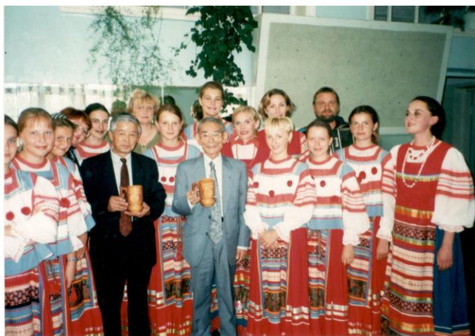
Ансамбль «Земляниченька» встречает гостей из Японии

В 2002 г. в учреждении культуры был запущен проект по развитию детского творчества - окружной праздник детского творчества «Улыбка».