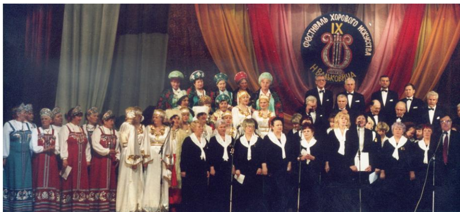
Дворец культуры химиков. Фестиваль хорового искусства. 2004 г.

20-й раз пройдет традиционный фестиваль хорового искусства им. Николая Вальковича (1997 г.).