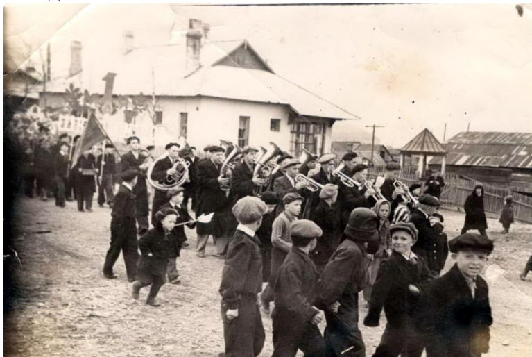
С духовым оркестром Дома культуры им. Калинина – на праздник

Дальневосточного горно-металлургического комбината им. В.И. Ленина, непосредственно его курировала администрация свинцового завода.