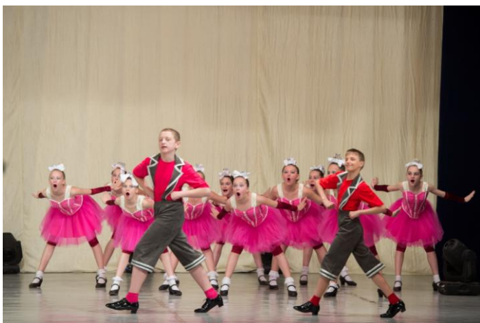
Танцевальный коллектив «Родничок».

Коллектив регулярно выезжает на краевые, региональные и международные конкурсы, где неизменно получает достойные награды. За последние четыре года коллектив «Родничок» - победитель следующих конкурсов: