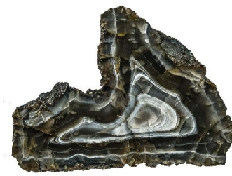
Агат верховьев р. Базовой (правый приток р. Большая Уссурка)

АГАТ - скрытокристаллическая разновидность природного кремнезема (SiO 2 ), представляет собой тонковолокнистый агрегат со слоистой текстурой и полосчатым распределением окраски, образованный слоями главным образом халцедона.