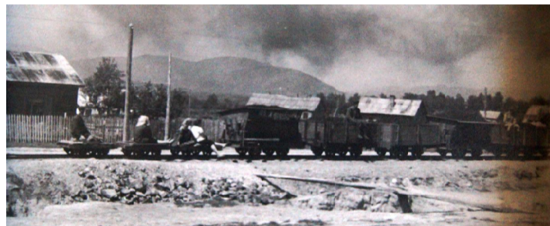
Дымит паровозик, везет груз и людей