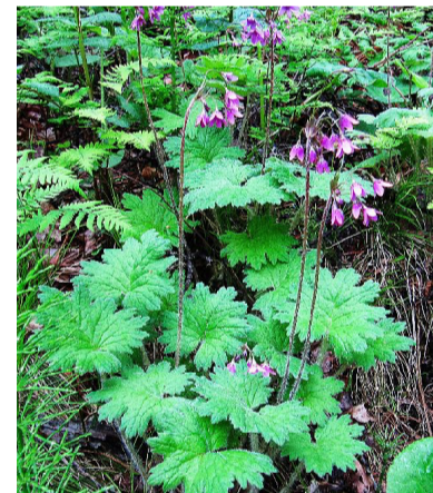
Кортуза двуцветная (Cortusa discolor) из семейства первоцветовых - очень редкое растение флоры Земли, обитающее на известняках бассейна р. Рудной

вал один из бохайских центров горной добычи золота, серебра, свинца и олова. После первичной переработки руды доставлялись в морской порт, следы которого были найдены археологами в 1972 г. на берегу протоки. Несколько раз в год тяжело нагруженные рудой парусные суда отправлялись в Бохай и, возможно, в Японию.