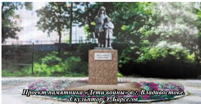
Проект памятника «Дети войны» в г. Владивостоке. Скульптор Э. Барсегов

В Дальнегорском городском округе зарегистрировано более 3000 человек, получивших статус «Дети войны». К этой категории отнесены люди, пережившие блокаду Ленинграда, узники фашистских лагерей, находившиеся под немецкой оккупацией. Дети войны – последнее поколение, пережившее и помнящее войну, а также все тяготы жизни в военные годы. Многим из них пришлось заменить родителей у станков и на полях, выполняя тяжелую, непосильную работу, помогать в семье, нянчась с младшими, голодать, недосыпать, рано распрощаться с детством и повзрослеть, а затем восстанавливать послевоенную разруху. Но,